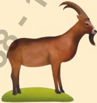
Çengel Boynuzlu Dağ Keçisi