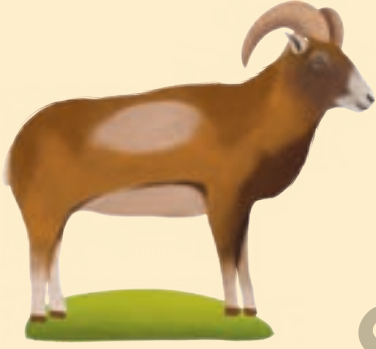
Anadolu Yaban Koyunu